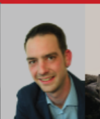
Tobias Blöcher Fraktionsvors.